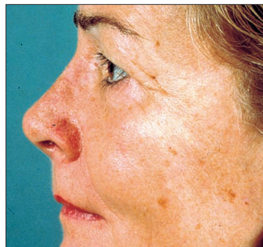
Bei der Nasenoperation wurde der Nasenhöcker beseitigt und die Nase insgesamt verkleinert.