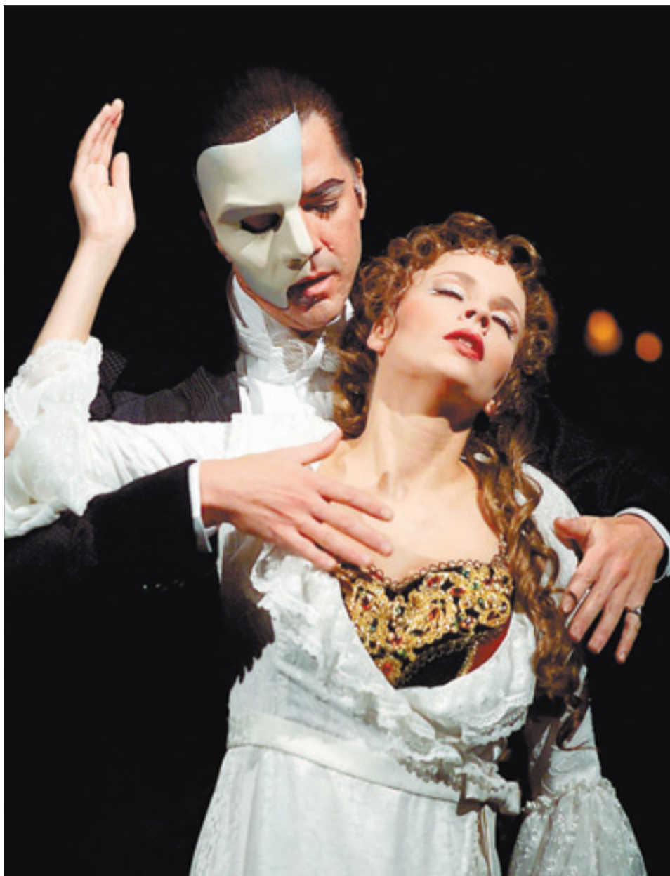
Wahre Schönheit kommt von innen. Das ist die Botschaft des Musicals „Die Schöne und das Biest“. Aber ist es immer so einfach?

Martin H. möchte reden. Über die „wunderbaren“ Ärzte im Stuttgarter Marienhospital, die seinen Lebensmut stärkten und ihn wieder so zusammengeflickt haben, dass er sich nun nach zwei Jahren wieder aus dem Haus traut. Darüber, wie „grausam wichtig“ Schönheit und Gesundheit in dieser Gesellschaft sind. Besonders im Scheinwerferlicht. Als es selbstverständlich war, hat er nie darüber nachgedacht. Als er beides nicht mehr hatte, merkte er, was Einsamkeit ist.